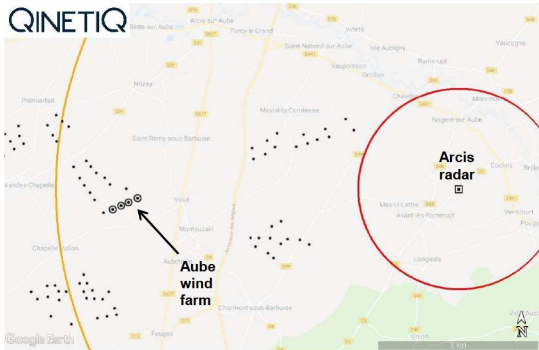
Figure 1-2: Proposed Aube turbine locations (white circles); Arcis radar (white square); coordination area (orange line); protection zone (red line); existing turbines (black dots)

The proposed turbines are inside the coordination area for the Arcis weather radar [3]. Accordingly, an assessment is required to confirm the impact of the proposed turbines on the radar.